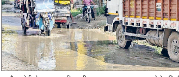
गन्नीर। खेड़ी रोड पर जमा दूषित पानी।

उन्होंने खुशी जताई कि प्रदेश सरकार ने गोहाना-महम रोड पर जिला की सीमा में गांव कथूरा तक सड़क पर वाहनों के बढ़ते दबाव को देखते हुए स्पेशल रिपेयर की मंजूरी दी है, इससे आमजन को बड़ी राहत मिलेगी। डॉ अरविंद शर्मा ने बताया कि मुख्यमंत्री नायब सिंह सैनी द्वारा प्रदेश में सड़कों को बेहतर बनाने के लिए विशेष अभियान चलाया जा रहा है।