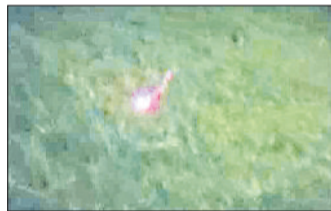
सोनीपत। पार्क में गिरा संदिग्ध ड्रोन डम्मी।

शहर के सीआरए कॉलेज के पास आसमान में संदिग्ध ड्रोन जैसी वस्तु घूमती दिखाई देने से हड़कंध मच गया। आसपास के लोगों ने तुरंत इसकी सूचना पुलिस व गुप्तचर विभाग को दी। सूचना मिलते ही मौके पर पुलिस और खनिष्ठा विभाग की टीमें पहुंची और जांच शुरू की। जब वस्तु को कब्जे में लिया गया तो वर डोरेमोन की डम्मी निकली। स्थानीय लोगों ने बताया कि कुछ देर तक आसमान में उड़ती वस्तु देखकर उन्हें लगा कि कोई ड्रोन कैमरा उनके ऊपर मंडरा रहा है। कॉलेज और आसपास के क्षेत्र में अफरा-तफरी का माहौल बना गया। जांच टीम ने बताया कि यह किसी ने मजाक के तौर पर उड़ाया होगा, लेकिन सुरक्षा की दृष्टि से इस तरह की घटनाओं को हल्के में नहीं लिया जा सकता। नतीजे कि पिछले कई दिनों से यमुना नदी से सटे गांवों में भी संदिग्ध ड्रोन जैसी गतिविधियां दिखाई देने की सूचना