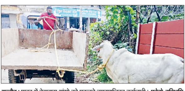
गन्नीर। शहर में बेसहारा गांयों को पकड़ते नगरपालिका कर्मचारी।

शहर की सड़कों पर घूमते बेसहारा गोवंश से परेशान लोगों को फिलहाल कुछ राहत मिलने की उम्मीद जगी है। नगरपालिका ने सोमवार से बेसहारा गोवंश को पकड़ने का अभियान शुरू कर दिया है। नगरपालिका कर्मचारी सड़कों पर झुंड में घूम रहे गाय और नंदी को पकड़कर गाड़ियों में भर रहे हैं। हालांकि सड़कों से बड़ी दिक्कत यह है कि गोशालाओं ने गोवंश लेने से हाथ खड़े कर दिए हैं। शहर की