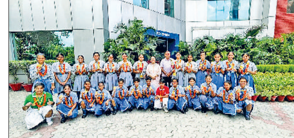
सोनीपत। विजेता खिलाड़ियों का स्वागत करती प्राचार्या साथ में अन्य।

सबसे बड़ी समस्या बने हुए हैं। ये झुंड के झुंड सड़कों पर घूमते हैं और आए दिन हादसों को न्योता देते हैं। कई बार ये नंदी राहगीरों को घायल भी कर चुके हैं। स्थानीय लोगों ने नगरपालिका के प्रयासों की सराहना की, लेकिन उनका कहना है कि जब तक नंदी के लिए ठोस व्यवस्था नहीं की जाती, तब तक शहरवा को राहत मिलना मुश्किल है। जनप्रतिनिधियों व प्रशासन से स्थाई समाधान के लिए जल्द से जल्द जगह का निर्धारण कर नंदीशाला खुलवा कर उनमें बेसहारा नंदी को छुड़वाने की व्यवस्था करने की मांग की है।