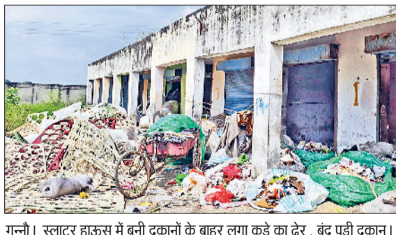
गन्नी। स्लाटर हाउस में बनी दुकानों के बाहर लगा कूड़े का ढेर, बंद पड़ी दुकान।

सोनीपत। खरीफ सीजन में फसलें अंतिम दौर में हैं। इस समय बाजरा, धान और कपास की फसल में फूल और बालियां आने का चरण है। ऐसे में वर्षा के कारण कीट लगने का खतरा बढ़ गया है। किसानों को गुणवत्तापूर्ण खाद और कीटनाशक उपलब्ध हो, इसके लिए कृषि विभाग ने विशेष चैकिंग अभियान शुरू किया है। विभाग की टीमों ने सोनीपत और गोहाना में खाद व कीटनाशक की दुकानों पर छापेमारी की। इस दौरान 25 सैपल लिए गए, जिन्हें जांच के लिए भेजा गया है। अधिकारियों का कहना है कि यदि कोई सैमपल फेल होता है तो संबंधित विक्रेता पर नियमानुसार सख्त कार्रवाई की जाएगी। कृषि विभाग के अनुसार खरीफ सीजन में कीटनाशकों और खाद की मांग बढ़ जाती है।