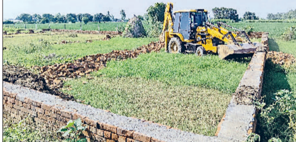
गन्नौर। गांव बड़ौत की राजस्व भूमि पर विकसित की जा रही अवैध कालोनी में निर्माण को दहती जैसीबी।

जिला नगर योजनाकार विभाग की टीम ने शुक्रवार को गांव बड़ौत की राजस्व भूमि पर विकसित की जा रही अवैध कालोनी में कार्रवाई की। विभाग की टीम ने वहां 3 डीपीसी व कच्चे रास्ते ध्वस्त किए। वहां दूसरी ओर विभाग की कार्रवाई के बावजूद गन्नौर क्षेत्र में अवैध कालोनी काटने का धंधा लगातार फल फूल रहा है। शहर और आसपास कालोनाइजर बेखौफ कालोनियां काट रहे हैं। इससे साफ है कि विभाग की कार्रवाई केवल कागजों तक सीमित है। बड़ी औद्योगिक क्षेत्र फेज 3 के पास लहड़ेडी रोड पर, औद्योगिक क्षेत्र के फेज 2 के सामने व जीटी रोड किनारे अलग-अलग स्थानों पर