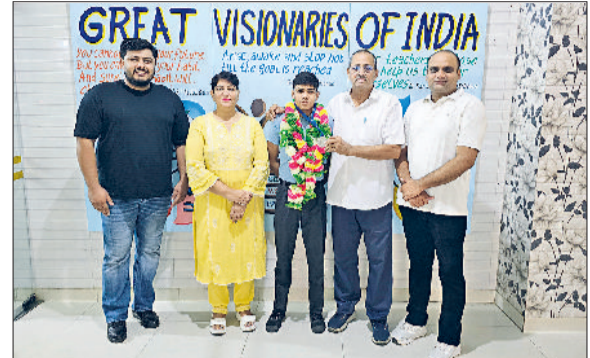
खरखौदा। पदक विजेता को सम्मानित करते।