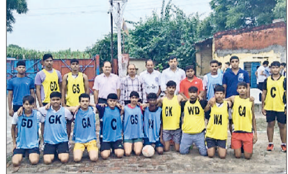
खरखौदा। विजेता नेटबॉल टीम के साथ आयोजक।