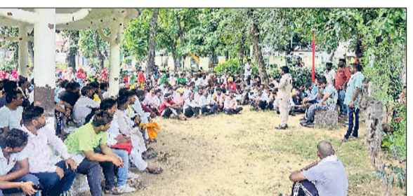
सोनीपत। बैटक के दौरान मौजूद टेका सफाई कर्मचारी।

रहा है। विभाग की टीमों मलेरिया जांच के लिए लोगों के रक्त के नमूने भी लेकर प्रयोगशाला में भेज रही हैं। मिली जानकारी के अनुसार नए मामलों में बड़खालसा, गन्नौर, कालूपुर, महावीर कॉलोनी और फिरोजपुर बांगर क्षेत्र से मरीज मिले हैं। इसके अलावा वायरल बुखार और मलेरिया के भी कई मरीज सामने आ रहे हैं। स्वास्थ्य विभाग ने लोगों को सलाह दी है कि रात में सोते समय मच्छरदानी का प्रयोग करें, क्वाइल, क्रोम या तेल का उपयोग करें और पानी जमा न होने दें। यदि डेंगू या मलेरिया के लक्षण दिखाई दें तो तुरंत चिकित्सक से संपर्क करें।