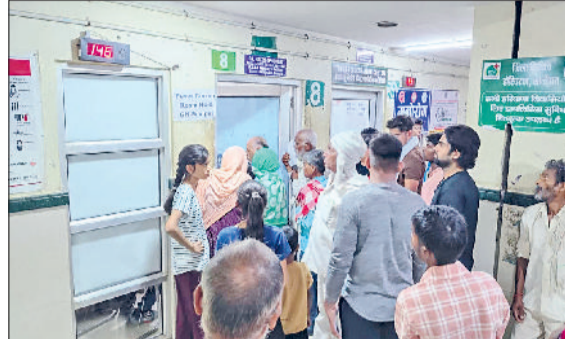
सोनीपत। फिजिशियन ओपीडी में लगी मरीजों की भीड़।

जिले में बारिश के मौसम में डेंगू और वायरल बुखार का खतरा लगातार बढ़ रहा है। जिले में पिछले एक सप्ताह में डेंगू के सात नए मामले सामने आए हैं। अब तक कुल 23 मरीज डेंगू से प्रभावित पाए जा चुके हैं। बढ़ती संख्या को देखते हुए स्वास्थ्य विभाग ने अलर्ट जारी कर दिया है और निगरानी अभियान तेज कर दिया गया है। स्वास्थ्य विभाग की 168 टीमों द्वारा घर-घर जाकर एंटी