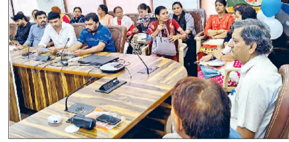
गन्नीर। स्कूल न्यूटी प्रशिक्षण कार्यक्रम में संबोधित करते हुए।