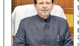
मंत्री डॉ. अरविंद शर्मा ने कहा कि इन आठ सड़कों की स्पेशल रिपेयर के लिए टेंडर प्रक्रिया पूरी कर ली गई है। विभाग के अधिकारियों को निर्देश दे दिए गए हैं कि बरसाती मौसम खत्म होने के तुरंत बाद ही इन सड़कों की स्पेशल रिपेयर करवानी सुनिश्चित की जाए। उन्होंने कहा कि गोहाना-महम मार्ग पर सोनीपत जिला की सीमा में गांव कथूरा तक स्पेशल रिपेयर को प्रदेश सरकार द्वारा मंजूरी प्रदान की जा चुकी है। इसके लिए भी विभाग द्वारा टेंडर लगाया जा चुका है। इस सड़क की स्पेशल रिपेयर होने से आमजन को बड़ी राहत मिलेगी।

इस कड़ी में गोहाना विधानसभा की आठ सड़कों की स्पेशल रिपेयर मंजूर की गई थी। अब इन आठ कि मुख्यमंत्री नायब सिंह सैनी द्वारा प्रदेश में सड़कों को बेहतर बनाने के लिए विशेष अभियान चलाया जा रहा है।